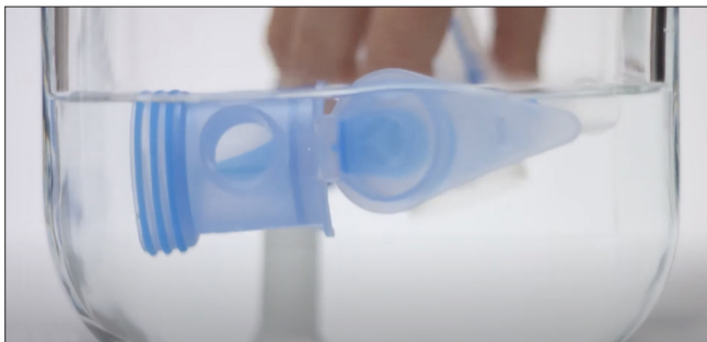
Wassen met drie druppels afwasmiddel.