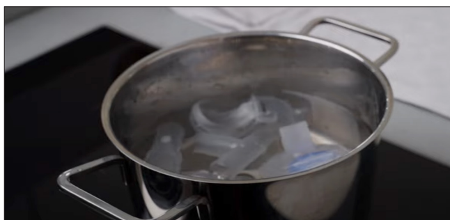
Uitkoken, 5 minuten of steriliseren in een sterilisator.