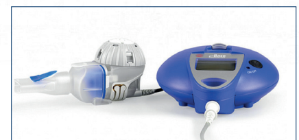
eFlow rapid eBase